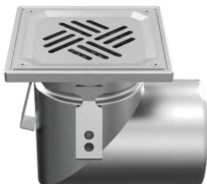
Z ODPŁYWEM DN 110