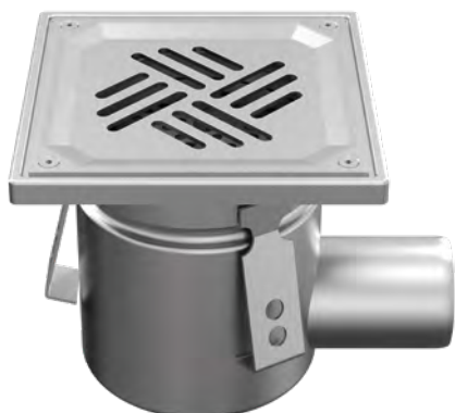
Z ODPŁYWEM DN 50